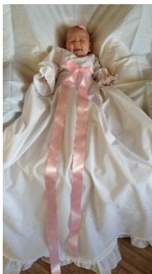
Døbt: 14.06.15 Hermine Taudal Dalgaard